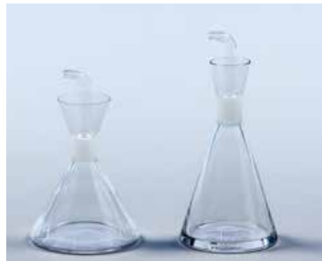
Setrilleres, c.1961, Rafael Marquina Audouard

Referència. El primer àmbit reuneix peces que han esdevingut exponents del bon disseny, prototipus d'èxit, dissenys personalitzats i dissenys capdavanter.