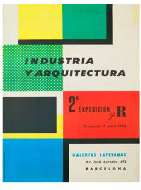
Cartell Industria y Arquitectura 2ª Exposición g.R. , 1954