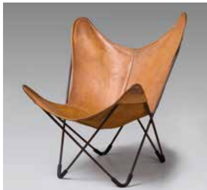
Cadira BKF, 1938

S'han seleccionat 238 objectes de la col·lecció del Museu del Disseny, representatius de les diferents etapes del disseny, des de l'època del GATCPAC fins avui, que en recullen els moments crucials i presenten els dissenyadors i les empreses que han estat impulsors del disseny a Catalunya i Espanya. Estan endreçats en funció de tres grans conceptes que valen per a tots els moments i tots els estils: la capacitat dels objectes d'esdevenir una referència, l'exploració dels materials i el context social. Es tracta d'una gran exposició de disseny industrial, didàctica i dinàmica, que és el resultat de la feina que ha dut a terme el Museu de les Arts Decoratives en els darrers vint-i-cinc anys, al costat dels dissenyadors i les empreses, per aplegar les peces més importants, les que han tingut més impacte i més projecció internacional, i construir el relat del disseny industrial al nostre país. Pilar Vélez, directora del Museu del Disseny, n'ha estat la comissària, juntament amb Teresa Bastardes i Rossend Casanova. La museografia de Lluís Pera estableix fites i punts de referència en cadascun dels àmbits, i presenta les peces formant part d'un tot. De fons, la pregunta: Què fa que determinats objectes que tenim a casa, al despatx o a la fàbrica, entrin a formar part del patrimoni cultural?