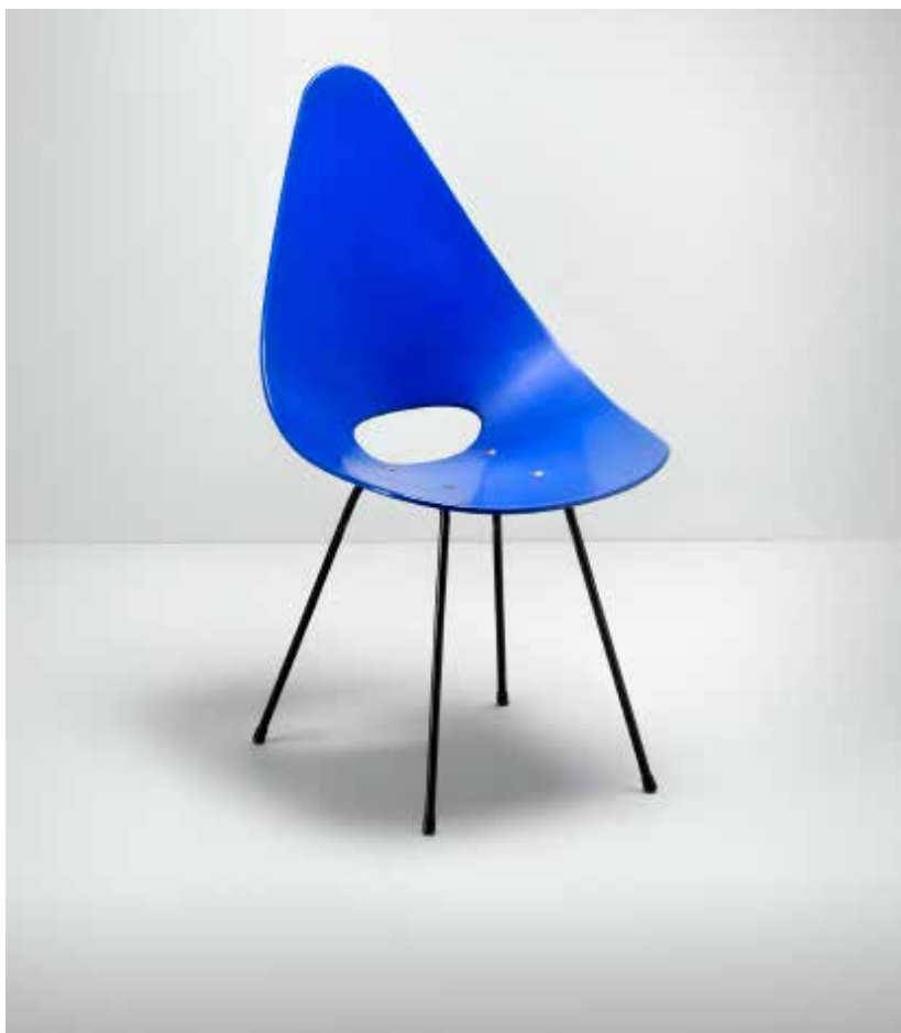
Cadira Pedrera, 1955