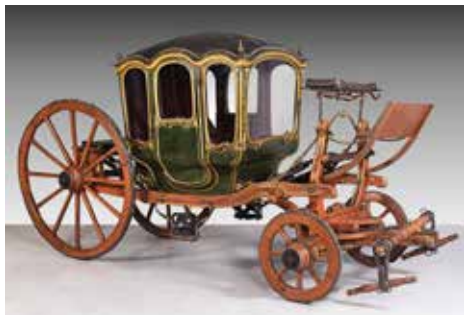
Berlina, Mallorca, c. 1750

Barcelona disposa d'una col·lecció excepcional dedicada a les arts de l'objecte, amb peces de totes les èpoques, tipologies i materials. És el testimoni del treball dels creadors des de l'edat mitjana fins avui. Permet conèixer com són i com han estat els barcelonins, des de diferents punts de vista: com vivien, com es relacionaven amb diferents tradicions culturals, quin pes tenien en la seva existència quotidiana les idees estètiques i les modes. Extraordinàries! Col·leccions d'arts decoratives i arts d'autor (segles iii-xx) , no és només una gran exposició dedicada a la vida material, la més completa, dinàmica i interdisciplinària que s'hagi presentat mai a la nostra ciutat: és una capbussada en un món de formes, de tècniques i de manufactures, que relliga el passat amb el present, els tallers artesans amb els estudis dels artistes que han abordat modernament les arts de l'objecte. Un recorregut enlluernador, per la bellesa de les peces singulars i per l'espectacularitat de les seleccions, que el muntatge d'Ignasi Bonjoch presenta en grans vitrines temàtiques. Cada peça llueix per ella mateixa i totes juntes formen un relat d'història de la sensibilitat, d'història cultural i d'història urbana. La comissària de l'exposició, Pilar Vélez, ha creat un relat dinàmic, amb contrapunts àgils que fan dialogar obres i autors.