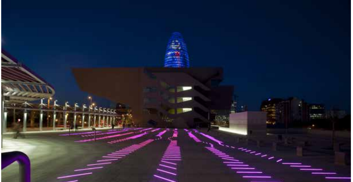
Edifici Disseny Hub Barcelona, seu del Museu del Disseny de Barcelona

El Museu del Disseny de Barcelona integra el present, el passat i el futur de les arts de l'objecte i del disseny.