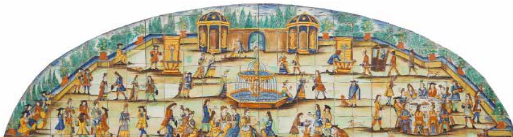
Plafó La xocolatada, Catalunya, 1710

Col·leccions d'arts decoratives i arts d'autor (segles iii-xx)