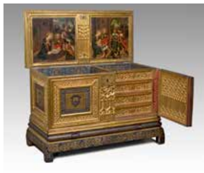
Caixa amb calaixos. El Naixement i l'Epifania Barcelona, 1525-1550