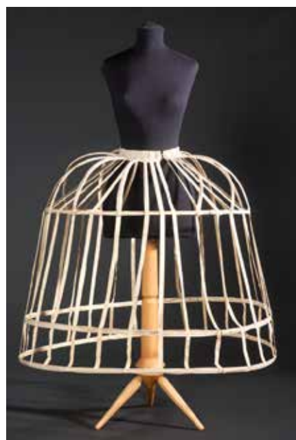
Mirinyac, c. 1850