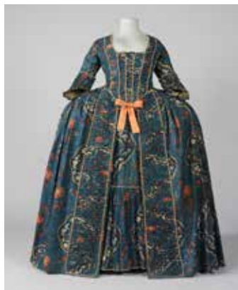
Vestit de cort, França, c. 1760

L'inici de l'exposició explica cinc accions bàsiques que al llarg de la història del vestit han servit per modificar l'aparença del cos: ampliar (mitjançant colls escarolats, pits inflats, calces de carbassa o braguetes inflades, volants i llaços), reduir (mitjançant cartrons de pit i cotilles), allargar (amb perruques i ornaments, barrets de copa o sabates de plataforma) i perfilar (amb calçons i mitges que creen una silueta filiforme, samarretes o malles) i una cinquena acció, destapar (amb transparències i peces de roba mínimes), corresponent a les èpoques de llibertat, que trenquen amb les convencions i els artificis del vestit: la revolució francesa, per exemple, els anys vint i trenta o els anys seixanta del segle xx.