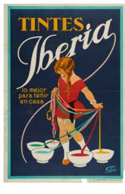
Cartell Tintes Iberia , 1950