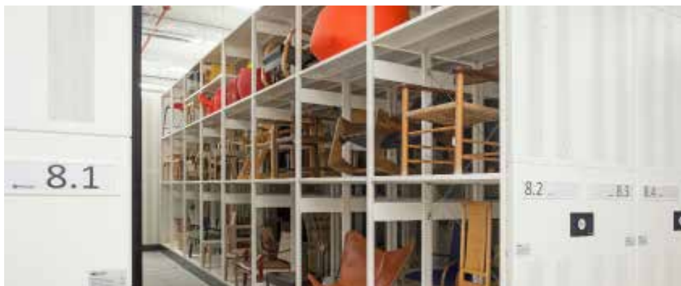
Una de les sales de reserva del Museu del Disseny

Edició de quatre catàlegs i una publicació divulgativa (en català, castellà i anglès)