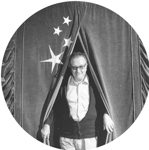
Joan Brossa a la 2ª Fira de Teatre al carrer de Tàrraga, 1982.