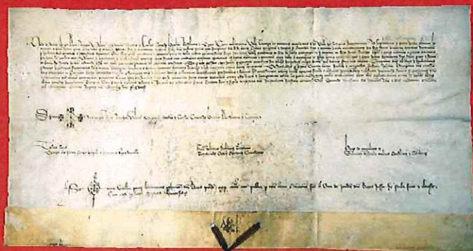
Imatge Pergami núm. 35 de la col·lecció de pergamins de l'Arxiu Municipal de Tremp

L'Arxiu Comarcal del Pallars Jussà compta amb 900 metres lineals (2014) de documentació.